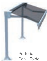
Portería Con 1 Toldo