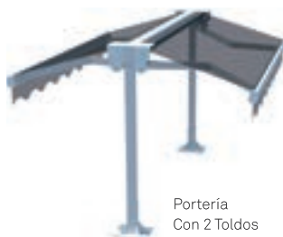
Portería Con 2 Toldos