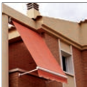
Sistema de fijación en posición modo toldo con brazos de 50cm.

Versátil sistema de toldo para todo tipo de balcones y ventanas..